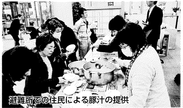
避難所での住民による豚汁の提供