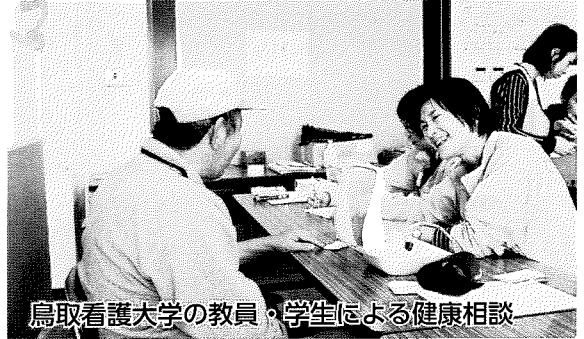
鳥取看護大学の教員・学生による健康相談