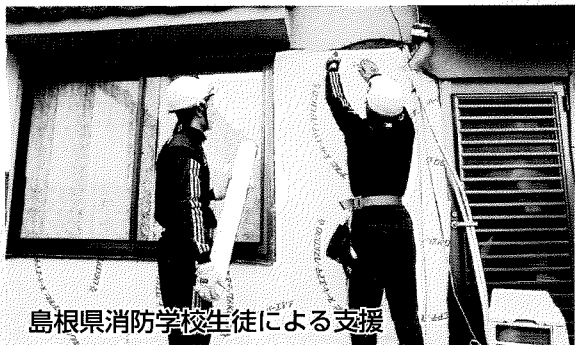
島根県消防学校生徒による支援