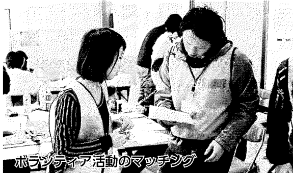
ボランティア活動のマッチング