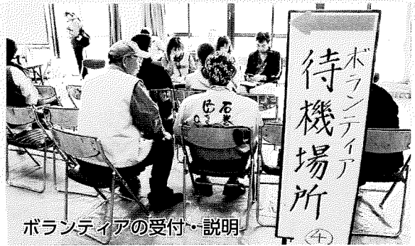
ボランティアの受付・説明