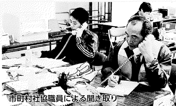
市町村社協職員による聞き取り