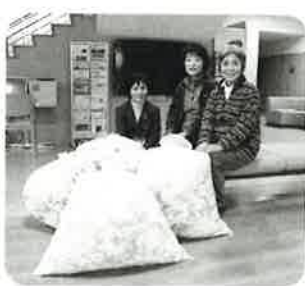
ペットボトルキャップ 77kg 黒住教婦人会倉吉支会様