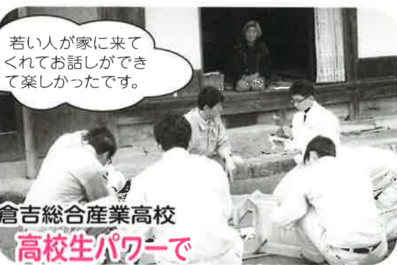
倉吉総合産業高校