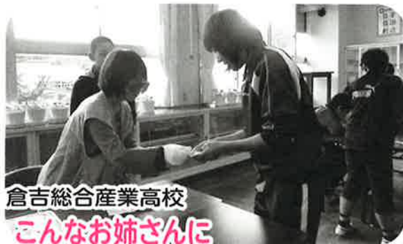
倉吉総合産業高校