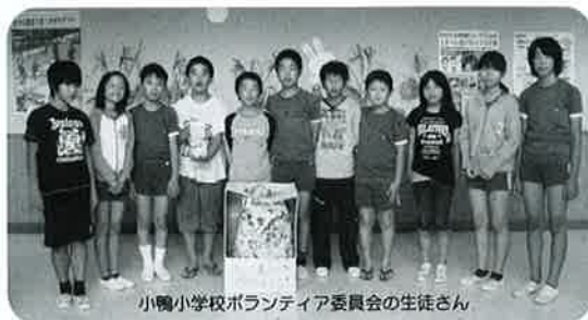
小鴨小学校ボランティア委員会の生徒さん

約1ヶ月半の間で収集されたペットボトルのふた約7,000個を、この度、ボランティアセンターに持って来ていただきました。